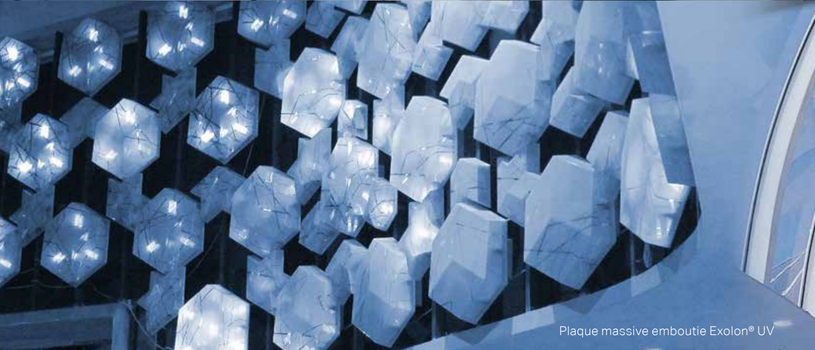
Plaque massive emboutie Exolon® UV